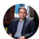
دکتر خواجه نصیری